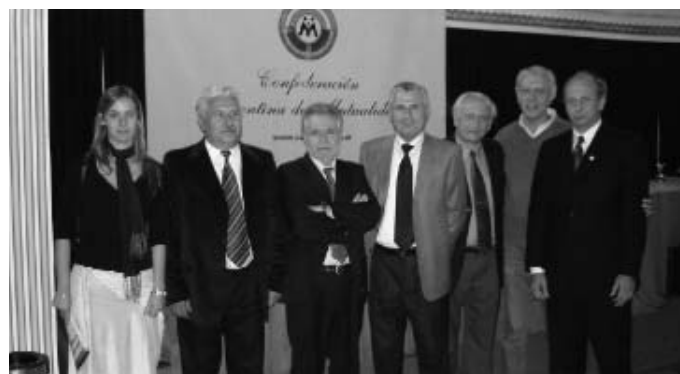
Delegados de Rosario a la CAM