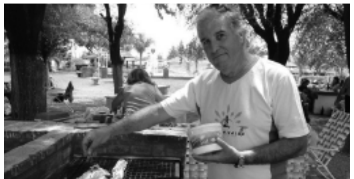
Preparando el asadito